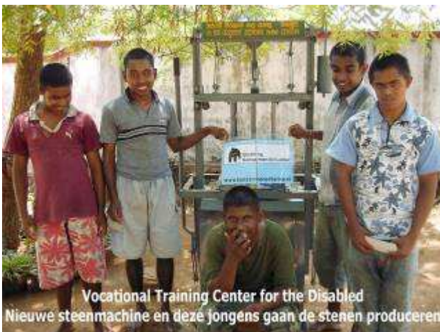
Vocational Training Center for the Disabled Nieuwe steenmachine en deze jongens gaan de stenen produceren

Ik ben erg benieuwd naar de vorderingen en we bezoeken meteen vanaf de tweede dag de lopende en afgeronde projecten. Stichting Kansarmen Sri Lanka is hoofdzakelijk op het platteland rondom de stad Kurunegala actief. De binnenlanden krijgen in verhouding tot de kustgebieden weinig aandacht en steun van hulporganisaties. In verschillende gastenboeken, van tehuizen die we bezoeken, herken ik alleen het Singalese handschrift, we komen op locaties waar voorheen nog geen westerse mensen zijn geweest.